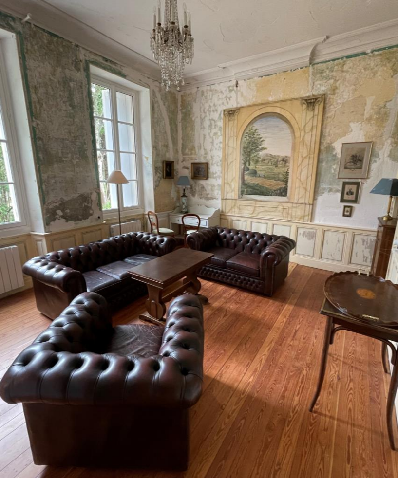
Petit salon - eller Tv-stue/gamer-room, Med 65" Tv og LED-kabel. Står rå med en såkaldt "Italiens renovering"