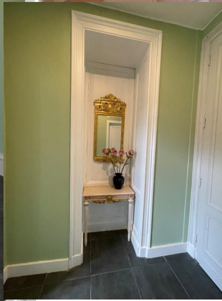
Entre – total ombygget fra et tidligere badeværelse.